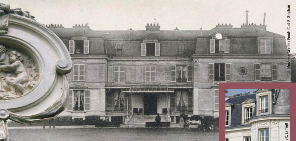
MONTIGNY-LE-BRETONNEUX (S.-et-O.) – Le Château (Façade Nord-Ouest)